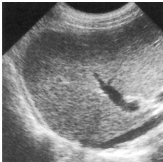
Slika 1. Normalan ultrazvučni nalaz jetre Figure 1. Normal ultrasound finding of the liver

Ultrazvučnim pregledom zdrave jetre njen parenhim je sitnozrnaste strukture, homogen i srednje ehogenosti. Ehogenost jetrenog parenhima je nešto ehogenija od parenhima bubrega i hipoehogenija od parenhima gušterače 6 . Normalan ultrazvučni nalaz jetre je prikazan na slici 1.